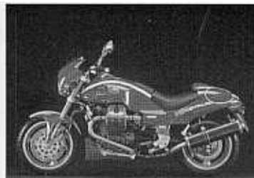
V10 CENTAURO SPORT

2 cyl, 4-takt, 992 cc, 88Nm/5800 rpm, 95hk/8200 rpm, kompression 10,5:1, 5-växlad, hjulbas 1475 mm, sitthöjd 760 mm, tankvolym 18 liter, torrvikt 224kg färger: met.antracit, met.mörkröd PRIS: 119 900:-