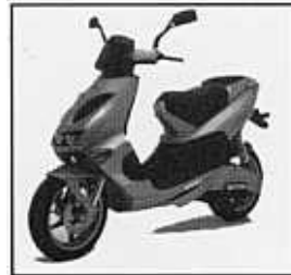
SR 50 WWW / (STEALTH. LC)

1 cylindrig, 2-takt, luft (vatten)kyld med katalysator, 50cc, variomatic, elstart & kick, skivbroms fram - trumbroms (skiva) bak, däck: fr.120/90x10" bak 130/90 x10" (fr.120/80x12" bak 130/80x 12"), torrvtikt 85kg (87kg), färger: orange, svart/gul, blå/grå, (silver) PRIS: 19 990:- (22 990:-)