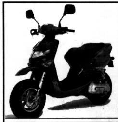
RALLY AC (LC)

1 cylindrig, 2-takt, luftkyld, 50cc, variomatic, elstart & kick, skivbroms fram, trumbroms bak, däck: fr.2.50x 16" bak 2.75x16", torrvtikt 71 kg färger: blå, silver PRIS: 18 490:-