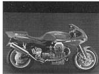
1100 SPORT INJECTION