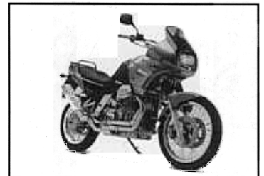
QUOTA 1100 ES

CALIFORNIA 1100 EV. 2 cyl, 4-takt, 1064cc, 95,1Nm / 5000 rpm, 75hk / 6400 rpm, kompression 9,5:1, 5-växlad, hjulbas 1560 mm, sitthöjd 770 mm, tankvolym 18,5 liter, torrvtikt 251kg, färger: mörkblå / ljusblå-metallic, röd/cream, svart/grå-metallic PRIS: 119 900:-