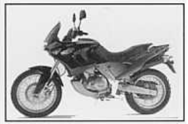
PEGASO III 650

1 cylindrig, 2-takt, vattenkyld, 125cc, vattenkyld, 32 hk / 11000 rpm, 21 Nm/10800rpm, 6 växlad, hjulbas 1345 mm, elstart, skivbroms fram och bak, torrvtikt 115 kg, tankvolym 14 liter färger: silver, röd/silver/lila PRIS: 44 900:-