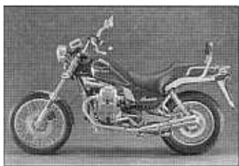
MOTO GUZZI NEVADA NT

2 cyl, 4-takt, 750cc, 70Nm / 5500 rpm, 58hk / 7500 rpm, kompression 9,5:1, 6 växlad, sitthöjd 760 mm, tankvolym 18 liter torrvtikt 180 kg, färger: röd/svart PRIS: prel. 79 900:- (lev 98-10)