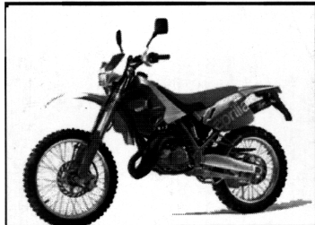
RX 125 LC

1 cylindrig, 4-takt, dohc, 652cc, vattenkyld, 50hk / 6250 rpm, 57,8 Nm/5500 rpm, kompression 9,1:1, 5 växlad, hjulbas 1480mm, sitthöjd 840mm, tankvolym 22 liter, torrvtikt 161kg färger: silver/silver, svart/silver PRIS: 59 900:-