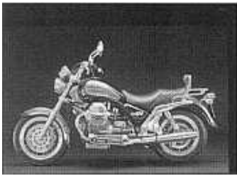
CALIFORNIA 1100 EVLR