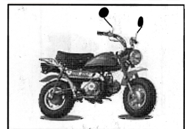
JC 50 Q

1 cyl, 4-takt, 49,5cc, 2,5Nm / 5100 rpm, 3,4hk / 7500 rpm, kompression 8,8:1, 3 växlad, hjulbas 900 mm, tankvolym 4,5 liter, torrvtikt 60kg, klassad som lekfordon färg: röd PRIS: 9 950:-