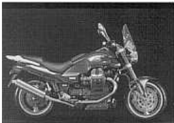
V10 CENTAURO GT

2 cyl, 4-takt, 1064 cc, 92Nm / 3800 rpm, 72hk / 2200 rpm, kompression 9,5:1, 5-växlad, hjulbas 1610 mm, sitthöjd 800 mm, tankvolym 20 liter, torrvtikt 245 kg, färger: metallic antracit m.fl. PRIS: prel. 95.000:- (lev 98-06)