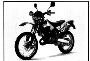
RX 50 LC

1 cylindrig, 2-takt, luft (vatten)kyld med katalysator, 50cc, variomatic, elstart & kick, skivbroms fram, trumbroms (skiva) bak, däck fr+bak 130/60x13", torrvtikt 87 (89) kg, färger AC: röd/grå, blå/grå, gul/grå färger LC: röd/grå/blå, svart/grå, gul/grå PRIS: 21 990:- (23 990:-)