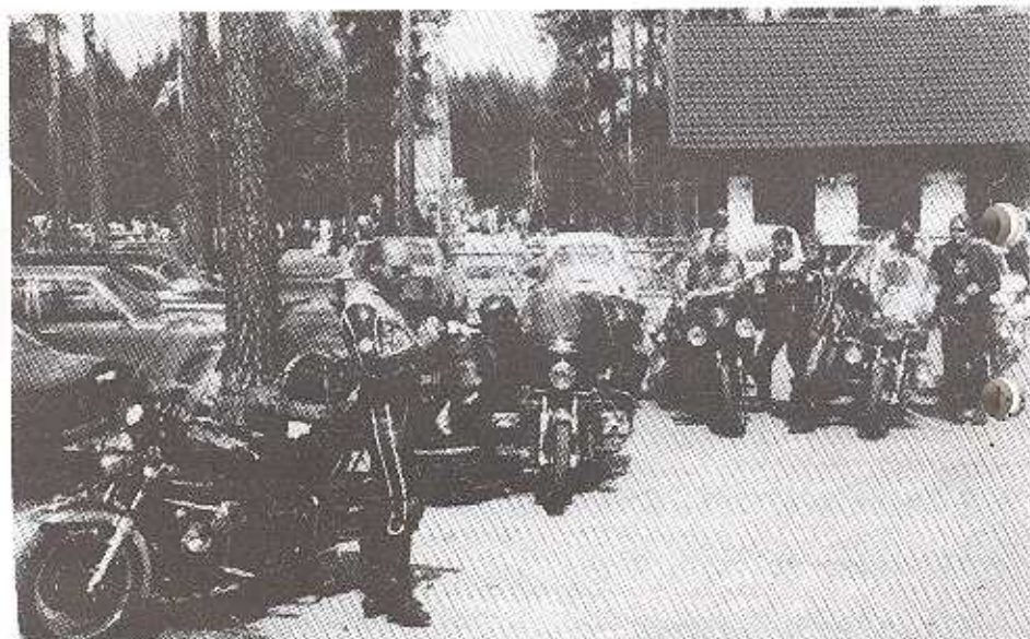
Rast i Morokulien på väg till Lillehammer.

Fredagen skulle vi få sköta oss själva eftersom norrmännen jobbade denna dag. Jag samlade på mig ett stim med California II:or och åkte Per Gynt vei mellan Vinstra o Lillehammer. Den var egentligen avstängd men med Guzzin tar man sig fram mellan djupa diken och gropar uppkomna av snösmältningen.